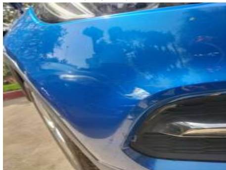
Bouclier avant (Impact)