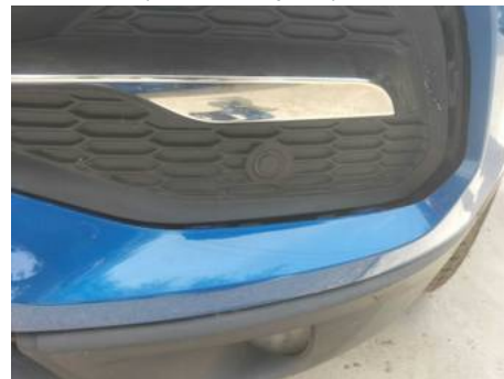
Bouclier avant (Défaut aspect)