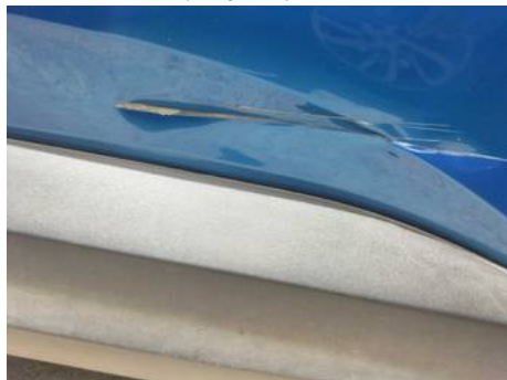
Porte avant droite (Rayure)